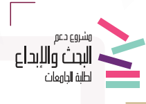
مشروع دعم البحث والإبداع لجامعة الجوف