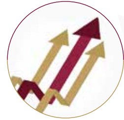
برنامج رفع قابلية التشغيل