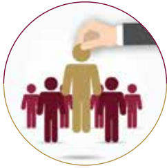
برنامج بناء القدرات

ويتركز عمل برامج ومبادرات الصندوق في خمسة محاور رئيسية هي: