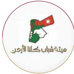
هيئة شباب كلنا الأردن