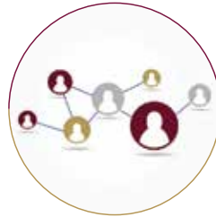
برنامج التواصل والتوعية المجتمعية